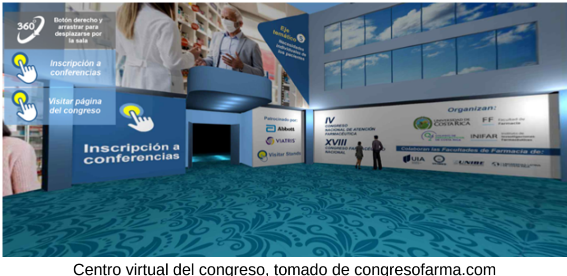
Centro virtual del congreso