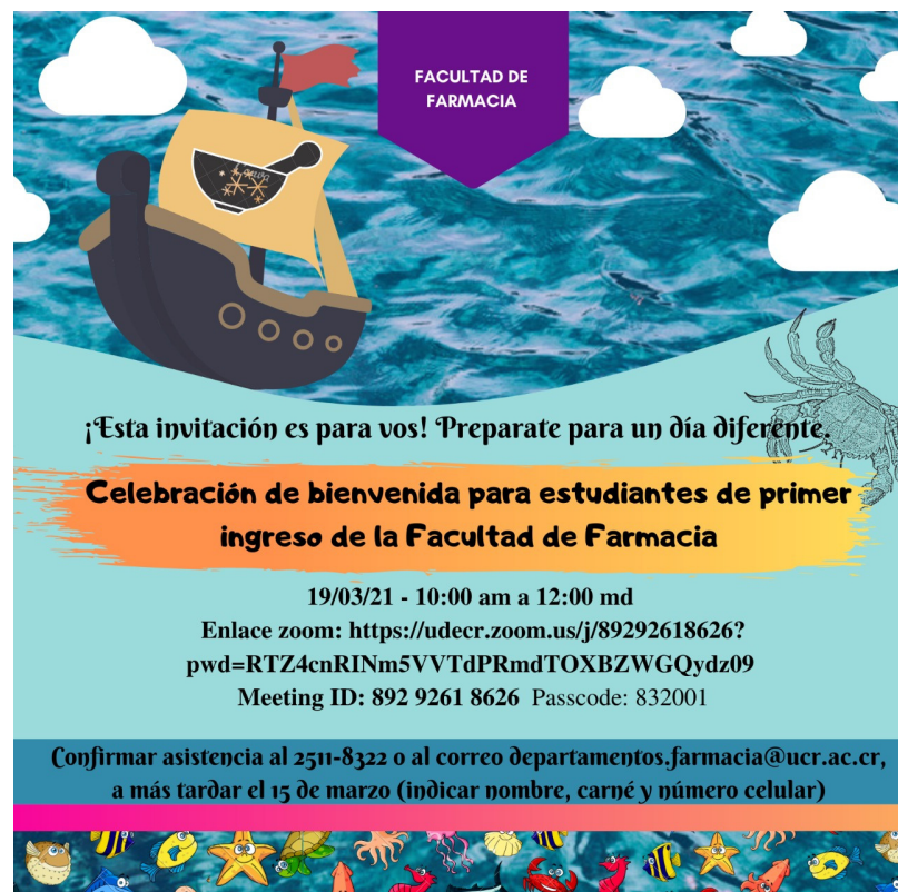
Créditos: Programa de Liderazgo

Para la Facultad de Farmacia, es un honor realizar la actividad de bienvenida de los estudiantes de nuevo ingreso este 2021. Como se ha hecho anteriormente, el fin es colaborar con la adaptación a la vida universitaria de nuestros estudiantes. Este año se les invita a una sesión virtual en la que pueden conocer a sus compañeros, a los miembros de la Asociación de Estudiantes y conocer a algunos de sus profesores. Así como compartir expectativas y experiencias. ¡Los esperamos!