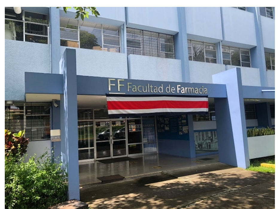
Créditos: Dra. Jeimy Blanco.

Con orgullo la Facultad de Farmacia celebra durante todo el mes de septiembre el Bicentenario de la independencia del país. El ejercicio de la farmacia se inició desde la época colonial pero formalmente fue 76 años después de la declaración de nuestra Independencia cuando empezó a funcionar la Escuela de Farmacia, la cual fue una de las bases sobre las que se creó nuestra Universidad de Costa Rica. Hemos contribuido durante todos estos años en el fortalecimiento de las políticas de salud del Estado costarricense y al cuidado de la salud de su población y continuaremos con orgullo siendo parte de esta historia. ¡La historia la construimos juntos!