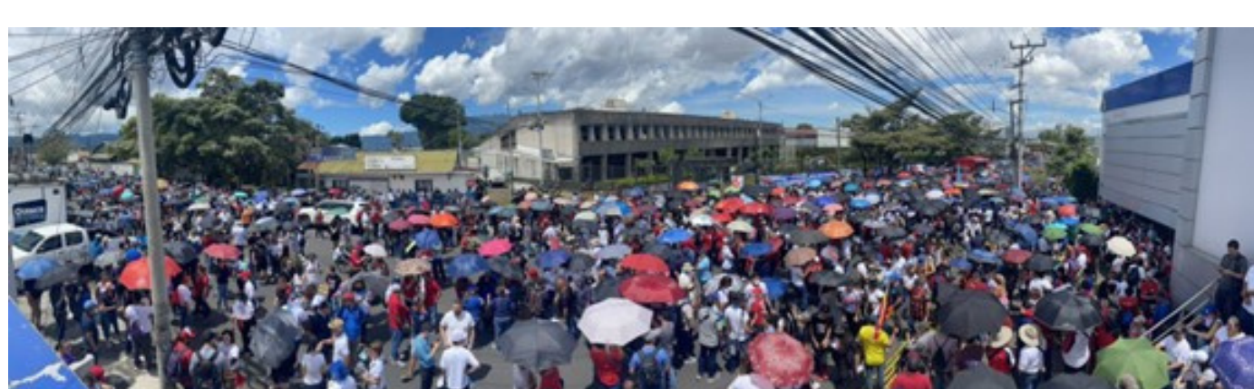
Créditos: Dra. Alejandra Fernández.