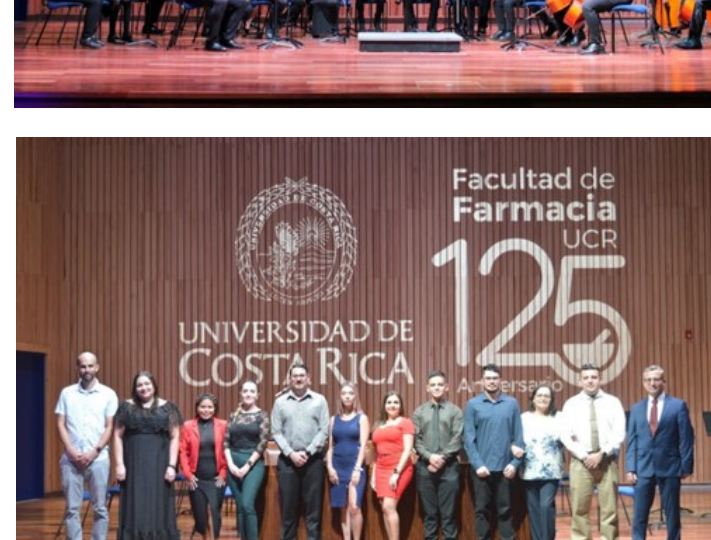
Créditos: Dra. María Laura y Óscar Salazar.

Les recordamos que el boletín de nuestra Facultad es un medio por el cual todos ustedes pueden utilizar para divulgar diferentes actividades en las que participaron o bien para anunciar alguna de ellas. Puede contactarse con la