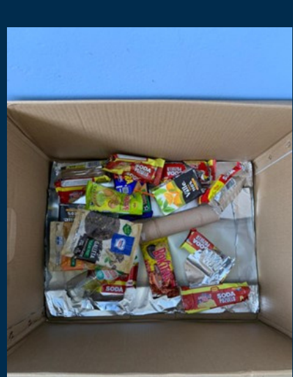
Créditos: Dra. María Laura Bonilla.

Los primeros días del mes de setiembre se colocaron en los comedores del primer y tercer piso de nuestra Facultad, un par de recipientes para colocar objetos de naturaleza reciclable que podrían rápidamente desecharse en la basura común. Para facilitar esta actividad, se colocaron justo encima de los basureros para residuos convencionales letreros llamativos que invitan a la segregación. El propósito de esta iniciativa es optimizar la gestión de residuos a la luz de la sostenibilidad. La experiencia de los primeros días de uso ha sido muy positiva, pues no sólo se ha cumplido el propósito de rescatar artículos reciclables, sino que éstos se han depositado limpios. Además, se resaltó también la necesidad de gestionar de mejor manera los productos no reciclables, como los empaques metalizados de galletas, por lo que se colocarán también botellas para la elaboración de eco-bloques en los próximos días. La información propia de estos últimos será brindada más adelante. ¡Muchas gracias por participar en esta iniciativa y contribuir con las acciones en pro del ambiente!