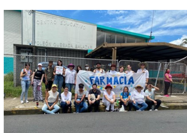
Cortesía: Dra. Victoria Hall.